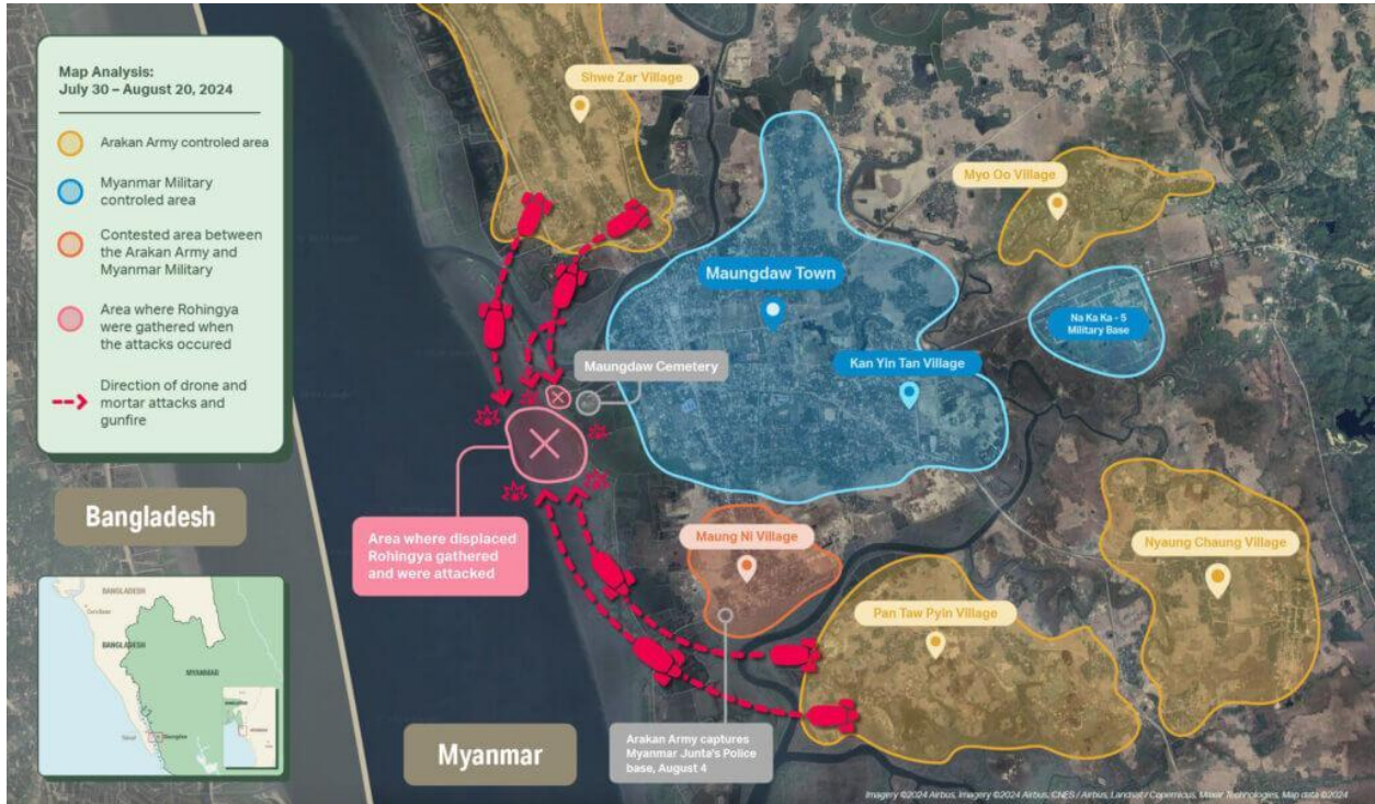
Map Analysis. Click to enlarge.

၂၀၂၄ ခုနှစ် ဧပြီလမှ စတင်၍ Fortify Rights သည် ရခိုင်ပြည်နယ်အတွင်း မကြာသေးမီကဖြစ်ပွားခဲ့သည့် အရပ်သားများအပေါ် တိုက်ခိုက်မှုများနှင့် ပတ်သက်၍ ရိုဟင်ဂျာအရပ်သား ၂၃ ဦးကို တွေ့ဆုံမေးမြန်းခဲ့ပါသည်။ ရခိုင်ပြည်နယ်တွင် သြဂုတ်လ ၅ ရက်နေ့နှင့် ၆ ရက်နေ့တို့၌ ဖြစ်ပွားခဲ့သည့် တိုက်ခိုက်မှုများနှင့် သတ်ဖြတ်မှုများတွင် ရိုဟင်ဂျာအမျိုးသမီး၊ ကလေးများနှင့် အမျိုးသားများ၏ ရုပ်အလောင်းများကို ပြသထားသည့် ပွင့်လင်းရင်းမြစ် ဗီဒီယိုနှင့် ဓာတ်ပုံအထောက်အထားများကိုလည်း Fortify Rights မှ ပြန်လည်သုံးသပ်ခဲ့သည်။