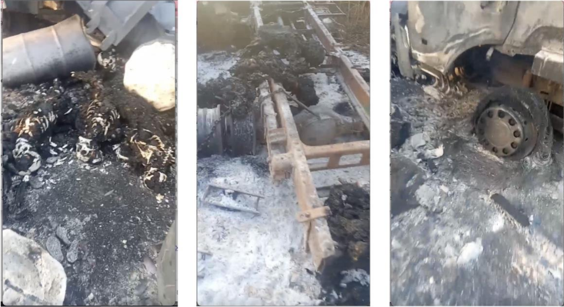
ကရင်နီပြည်နယ်၊ ဖရူးဆိုမြို့နယ်၊ မိုဆိုရွာနား KNDF စစ်တပ်များက ရိုက်ကူးခဲ့သည့် ခရစ်စမတ်အကြို အစုလိုက်အပြုံလိုက် လူသတ်မှုမှ မီးလောင်ခြစ်တူးနေသော ကိုယ်ခန္ဓာအကြွင်းအကျန်နှင့် မီးလောင်ခံထားရသော ယာဉ်များပါရှိသည့် လက်ကိုင်ဖုန်းဗီဒီယို screenshots များ ©Karenni National Defense Force, December 2021

အစုလိုက်အပြုံလိုက်လူသတ်မှု” နှင့် ပတ်သက်သည့် ထပ်လောင်းအသေးစိတ်အချက်အလက်များလည်း ပါဝင်ပါသည်။