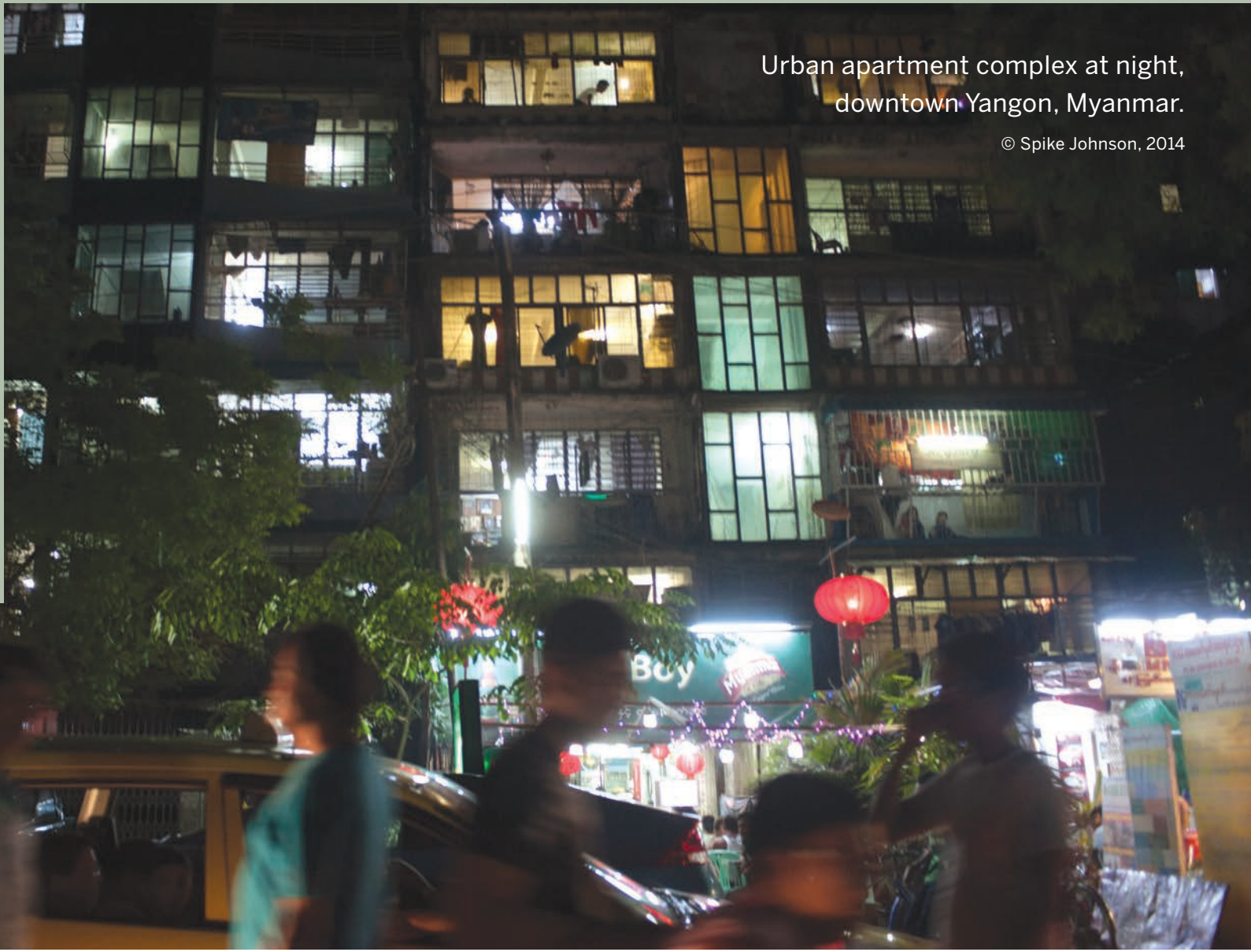
Urban apartment complex at night, downtown Yangon, Myanmar.